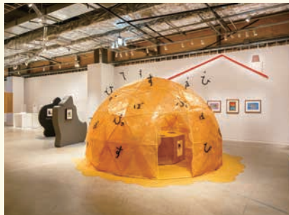
東京会場 展示風景