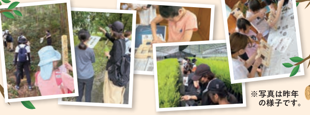
※写真は昨年 の様子です。