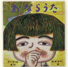
『おならうた』(絵・飯野和好) 絵本館 2006