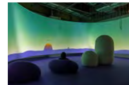
東京会場 展示風景