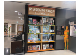
▲売り場 (3 階受付前)

●出品者が制作に全く携わっていない市販の商品や既製品等●著作権、公序良俗、法律に反するようなもの●危険物や周りの迷惑になるようなもの●土や液体で館内を汚す恐れのあるもの●虫を展示室に運ぶ可能性のあるもの●飲食物 (菓子、飲料、青果、お弁当など)●生き物●刃物、モデルガン、エアガン等の危険物●火器、花火、火薬、可燃ガスその他の危険物等、犯罪に使用され得るもの●医薬品、医療機器等の品質、有効性及び安全性の確保等に関する法律 (以下「薬機法」) による規制を受ける医薬品、医療機器、医薬部外品又は化粧品等●この他にも、当館が不適切と判断したものは販売不可。