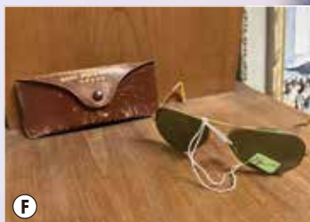
A: マッカーサーと昭和天皇 B: 昭和天皇からの手紙 C: 占領下の当時の風景 D: 日本国憲法の発効に署名する昭和天皇 E: 米軍が描いた新日本国政府の組織図(案) F: トレードマークのサングラス