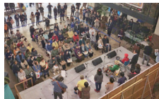
様々なイベントが開催できます