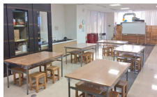
絵本や木の遊具を備えたキッズルーム、ご飲食も可能な交流サロン