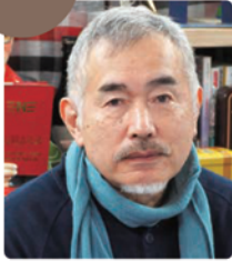
後小路 雅弘 Masahiro Ushiroshouji 北九州市立美術館 館長