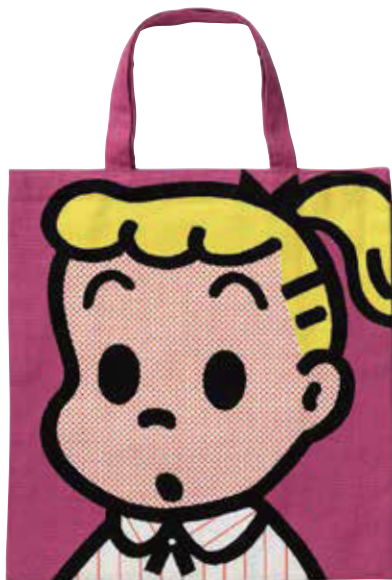
スクールバッグ (OSAMU GOODS®) 1992年 ©Osamu Harada / Koji Honpo