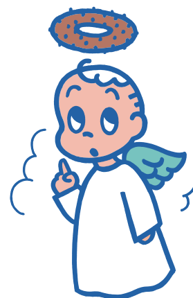
ミスタードーナツ キャンペーン用キャラクター 1986年