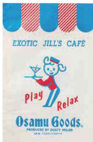
ショップバッグvol.47 (OSAMU GOODS®) 1989年 ©Osamu Harada / Koji Honpo