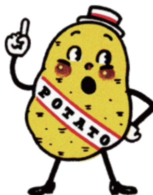
カルビー「ポテトチップス」など マスコットキャラクター 1976年 作：原田治