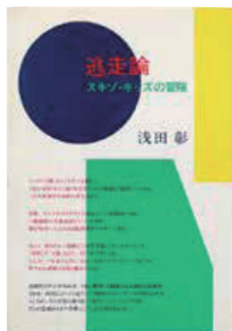
浅田彰「逃走論」 作品集 1984年 筑摩書房 装幀：原田治