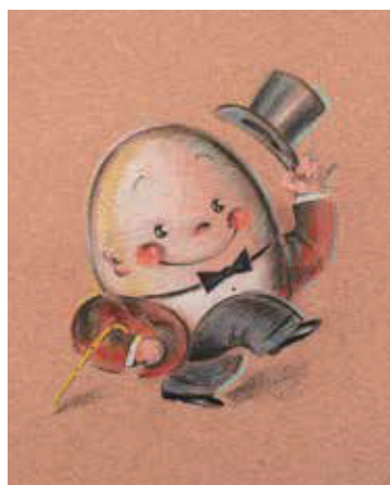
HUMPTY DUMPTY (OSAMU GOODS用原画) 1970年代後半-1980年前半