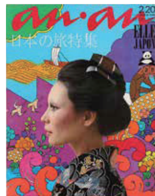
「an·an」第47号 1972年 平凡出版 アートディレクション：堀内誠一 表紙イラストレーション：原田治