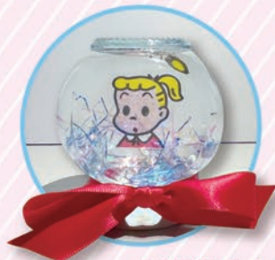
KAWAIIスノードーム イメージ

10:00~18:00(最終入場17:30まで) 休館日:12/31(日)、1/1(月)、1/2(火)