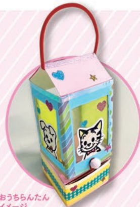
おうちらんだん イメージ

休館日 毎週火曜日(火曜日が祝日の場合、翌平日) ◎全館休館日 10/3◎、10/24◎、12/5◎、12/31◎