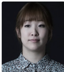
田中 千智 Chisato Tanaka 画家