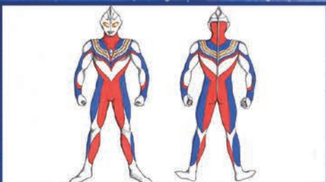
丸山 浩氏デザイン(ティガ)