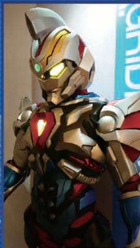
キラウカス・ツ(ウルトラマン)