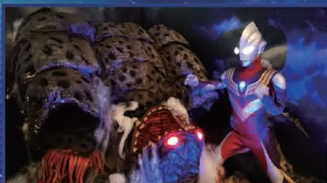
ゾリア(ティガ vs ガリアン)