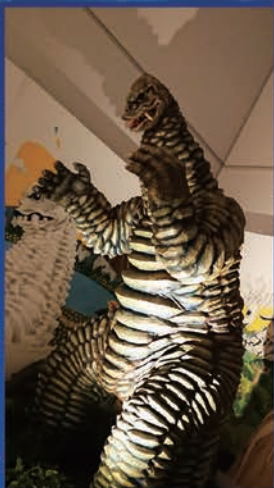
動刻(レッドキング)