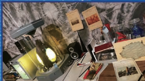
特撮美術(ドラゴンキングの卵他)