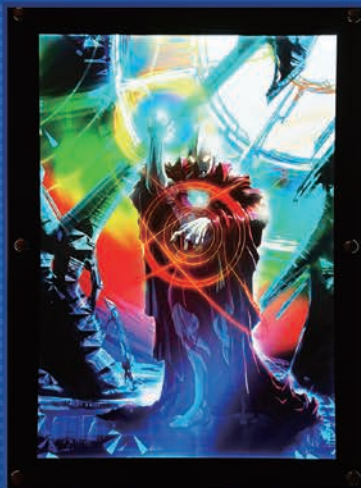
後藤正行描き下ろしデザイン(ウルトラマン)