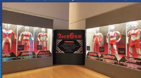
キラウカス・ツ(ウルトラ6兄弟)