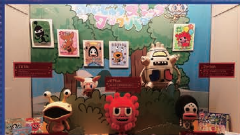
きばらうび氏デザイン(バット(セブレン他))