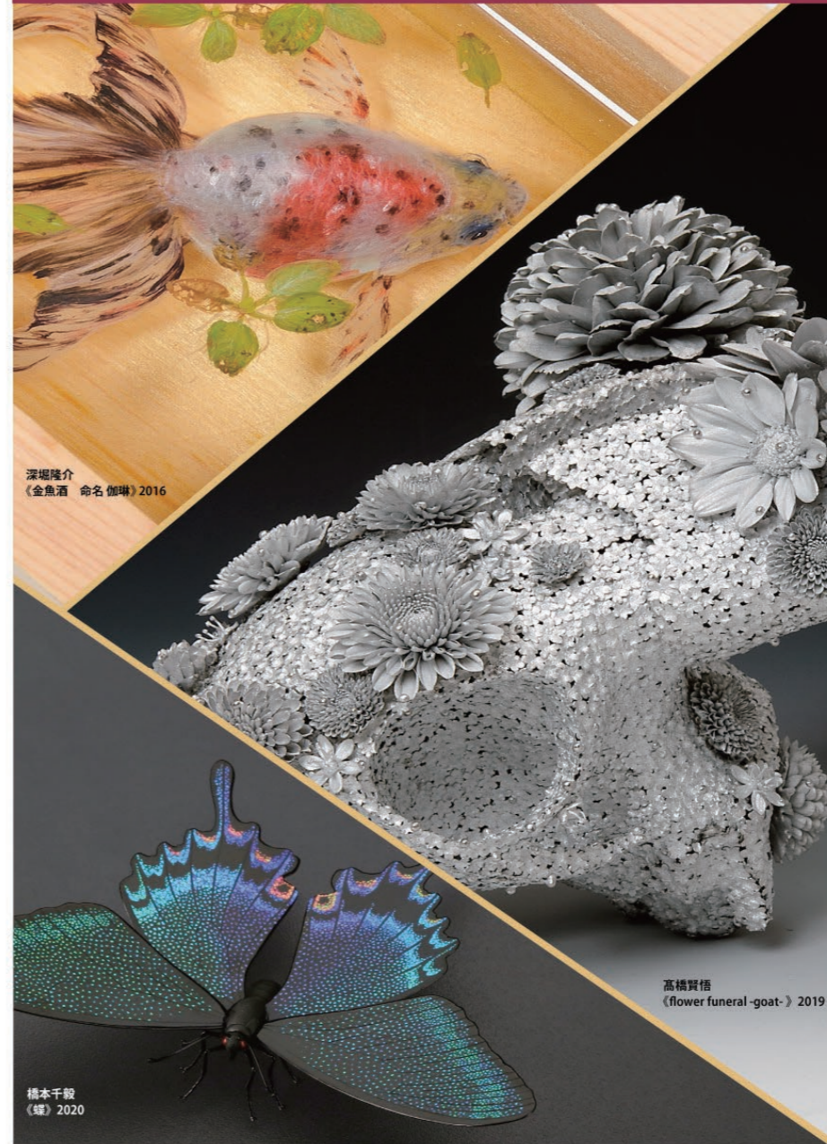
深堀隆介 《金魚酒 命名 伽琳》2016