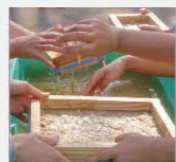
ワークショップのイメージ

和紙を漉いてハガキを作ろう!好きなパーツを入れてオリジナルにデコレーションしてね。