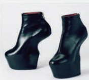
館鼻則孝 (Heel-less Shoes)

米歌手のレディ・ガガも愛用するヒールレスシューズを履いて、会場内のミニ・ランウェイを歩いてみよう!