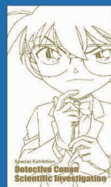
オリジナル チケットホルダー