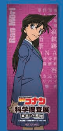
ブックマーカー 毛利 蘭