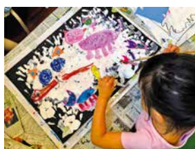
写真は講座のイメージです

創る楽しさ、夢中になる心。完成の喜び。お子さまの心の中にある何かを引き出します。お子さまのペースに合わせて制作できます。