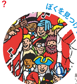
展覧会限定アート "Anniversary Ball for Japan" (部分、2017年)