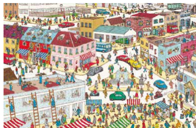
"In Town" 原画「ウォーリーをさがせ」(1987年)より