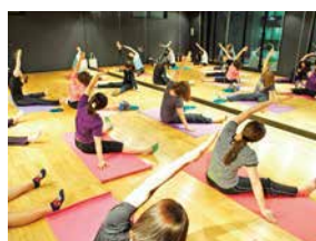
写真は講座のイメージです

骨盤からキレイで健康的なカラダに!腰痛・肩こり緩和、産後ケアや転倒防止にも効果的な講座です。