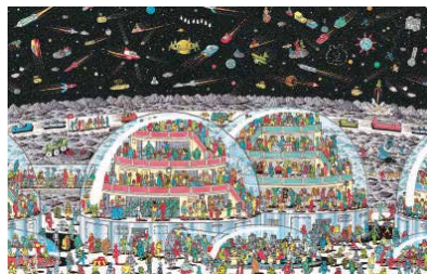
"In the Future" 原画「タイムトラベラー ウォーリーをおえい」(1988年)より