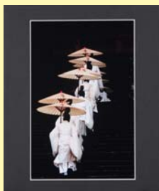
平成23年度写真部門大賞 歌津賢治「天昇」