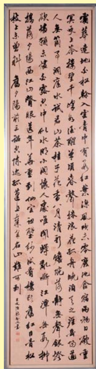
平成23年度書部門大賞 黒木知之「王女治詩」

車：宮崎自動車道宮崎ICより市内方面へ国道220号線を北へ10分 JR：宮崎駅下車、西口より徒歩15分 バス：橋通り3丁目下車すぐ ◎駐車場：山形屋東側YYパーク、メリージュ通り駐車場 ※駐車券提示で30%割引 (当館3階受付で発行)