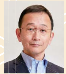
〈写真部門〉 やまぐち ともかず 山口 知一 公益社団法人 日本広告写真家協会 (APA) 九州支部部長 山口写真事務所 代表