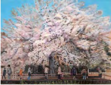
平成 24 年度 平面部門大賞 山野美美子「一心行の大桜」