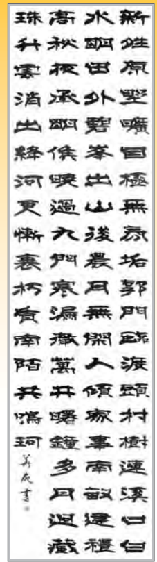
平成 24 年度 書部門大賞 緒方和子「王維詩二首」