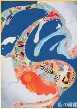
平成 24 年度 平面部門大賞 戎井まいこ「私の過程」