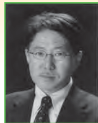
写真部門 富谷 正弘 (社)日本広告写真家 協会正会員 (APA)