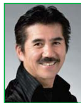
写真部門 東島 治男 (社)日本広告写真家 協会常務理事