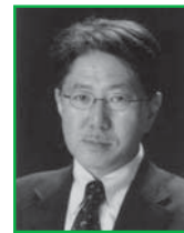
写真部門 富谷 正弘 (社)日本広告写真家 協会正会員 (APA)