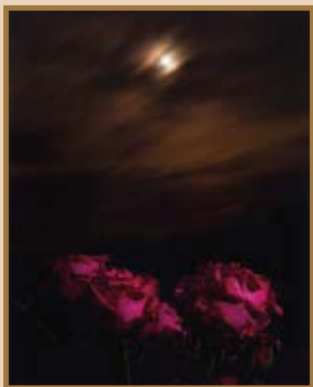
第35回写真部門大賞 吉木浩美「赤い月とバラ」