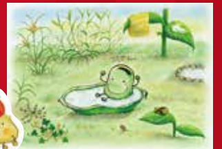
「そらめくんのベッド」