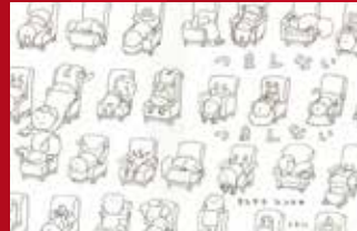
「つまんない、つまんない」