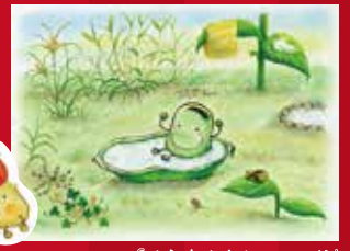
「そらめくんのベッド」