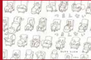
「つまんない、つまんない」